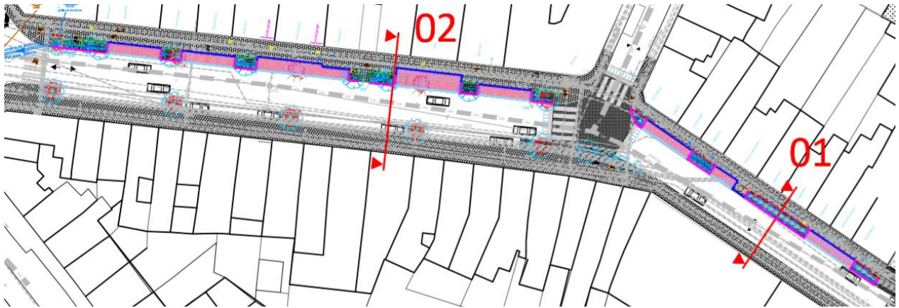
Plan des aménagements rue Vanpe