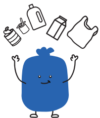
PLASTIQUE MÉTAL CARTONS À BOISSONS PLASTIC METAAL DRANKKARTONS