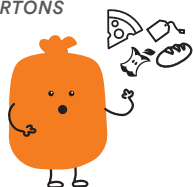
DÉCHETS ALIMENTAIRES VOEDSELAFVAL